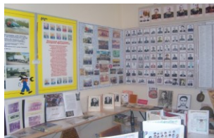
Музейная комната «Боевой и трудовой Славы»