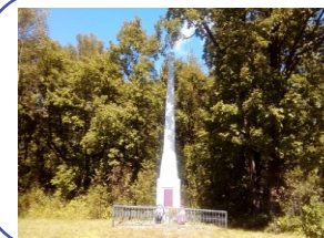
Памятник Партизанам погибшим в годы японской интервенции 1919г.