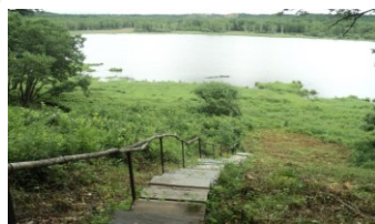
Тропа «Здоровья» на оз. Кедровом