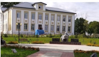
Сквер Памяти боевых действий